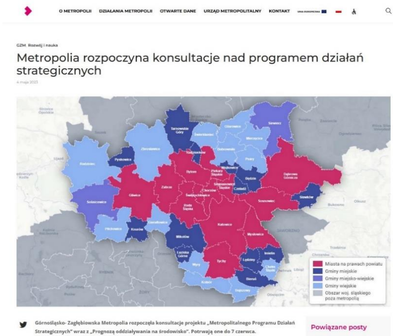
Rys. 3 Informacja o konsultacjach projektu MPDS - profil GZM na Facebook'u (zrzut ekranu)