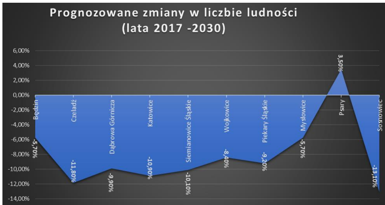
Rysunek 1. Wykres przedstawiający prognozowane zmiany liczby ludności w wybranych gminach GZM w latach 2017 – 2030